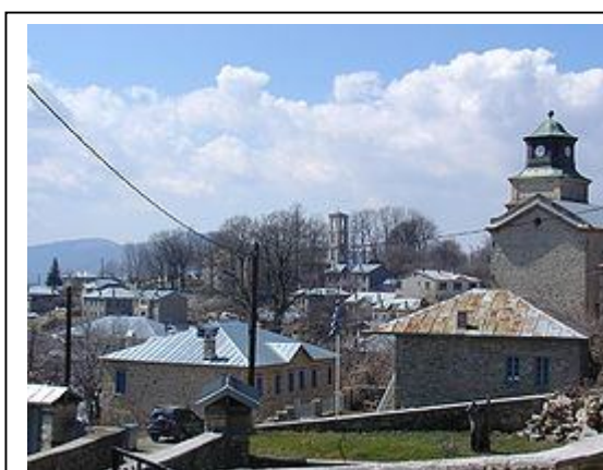
Αποψη του Νυμφαίου (Νιβεάστα)

στο καταπληκτικό χωριό «Ψαράδες», απ' όπου μετά, μέσα πάλι στο καταπληκτικό τοπίο πήραμε το δρόμο προς το βορριά, για να διανυκτερεύσουμε στη Φλώρινα, που απέχει 13 χιλιόμετρα από τα Σκόπια. Εκεί νιώσαμε περισσότερο Έλληνες και μάλιστα Έλληνες Μακεδόνες. Το επόμενο πρωί πήραμε το δρόμο της επιστροφής, όμορφο καιρό. Πρώτος σταθμός το Ευρωπαϊκό κέντρο προστασίας της καφέ αρκούδας «Άρκουρος» όπου νεαρά άτομα ασχολούνται με πάθος για την προστασία της Ελληνικής φύσης. Δεύτερος σταθμός τ' όμορφο παραδοσιακό χωριό Νυμφαίο με πλοία ιστορία. Σ' αυτό θ' αναφερθώ περισσότερο. Το χωριό Νυμφαίο ή Νέβεσκα είναι χαρακτηρισμένο ως «διατηρητέος παραδοσιακός οικισμός» και ανήκει στον Νομό Φλώρινας. Είναι χτισμένο στα 1.320-1405 μέτρα σε στο ανατολικό Βίτσι.