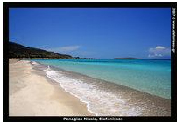
Η παραλία δίδυμο Φράγκος - Σαρακίνικο (Σίμος) Ελαφώνησος