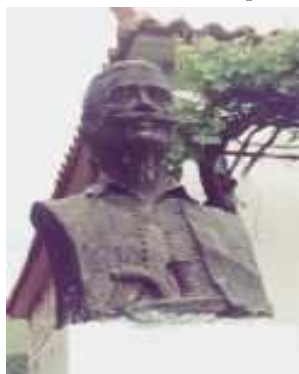
Η προτομή του Γκρίτζαλη στο Ψάρι

Ένα από τα οδυνηρότερα περιστατικά της νεότερης Ελληνικής Ιστορίας αποτελεί η τύχη του Γιαννάκη Γκρίτζαλη, οπλαρχηγού από το Ψάρι με πλούσια δράση στον απελευθερωτικό αγώνα του 1821. Η περιφρόνηση προς τους παλαιούς αγωνιστές ήταν βέβαια ένα γενικότερο φαινόμενο τον καιρό της Βαυαροκρατίας, όμως στο πρόσωπο του Θ. Κολοκοτρώνη, του Δ. Πλαπούτα, του Μητροπέτροβα και του Γκρίτζαλη βρήκε την ακραία εκδοχή της.