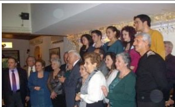
Μέλη του Συλλόγου με τους βραβευθέντες

Υπάρχουν ορισμένες «επετειακές» εκδηλώσεις ιδιαίτερα φορτισμένες από χαρά, συγκίνηση, ευχάριστη διάθεση, γιατί έτσι απλά μας ξαναγυρίζουν στα χρόνια των παιδικών μας αναμνήσεων. Και όσο αν φαίνεται υπερβολικό αρκούν μερικές στιγμές βαθιάς αναπόλησης για να γεμίσουν νοσταλγικά το όποιοδήποτε παρόν μας.