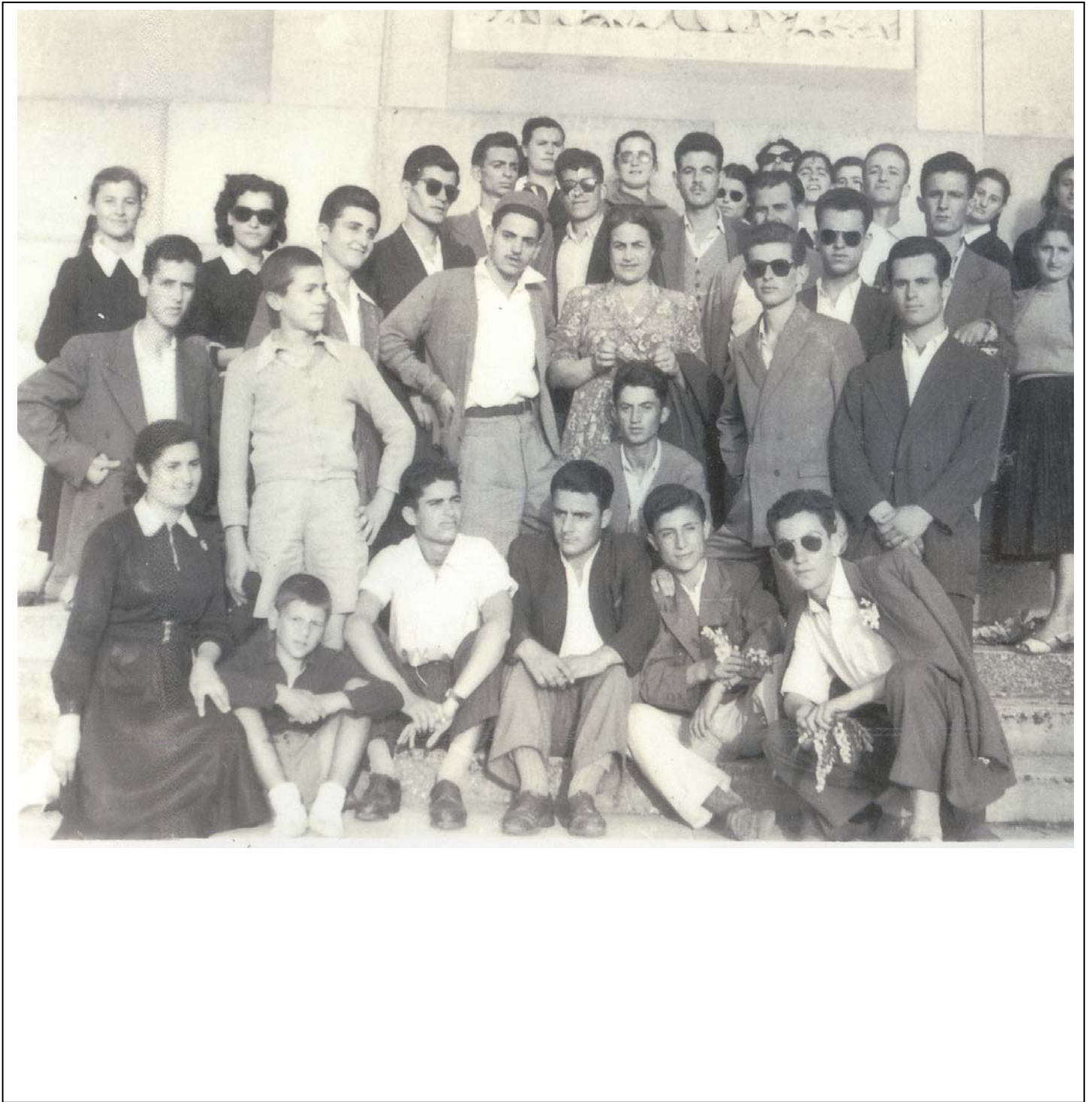
Αναμνηστική φωτογραφία της 8 ης Τάξεως του Γυμνασίου Κυπαρισσίας του σχολικού έτους 1953- 1954 στην ετήσια εκδρομή στο Μέγα σπήλαιο - Καλάβρυτα- Αγία Λαύρα, Μάιος 1954