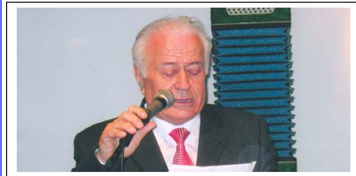
Προσφώνηση και χαιρετισμός του Προέδρου κατά την εκδήλωση βράβευση των αριστούχων και κοπής της πίττας του Συλλόγου την 11 η Ιαν. 2009.