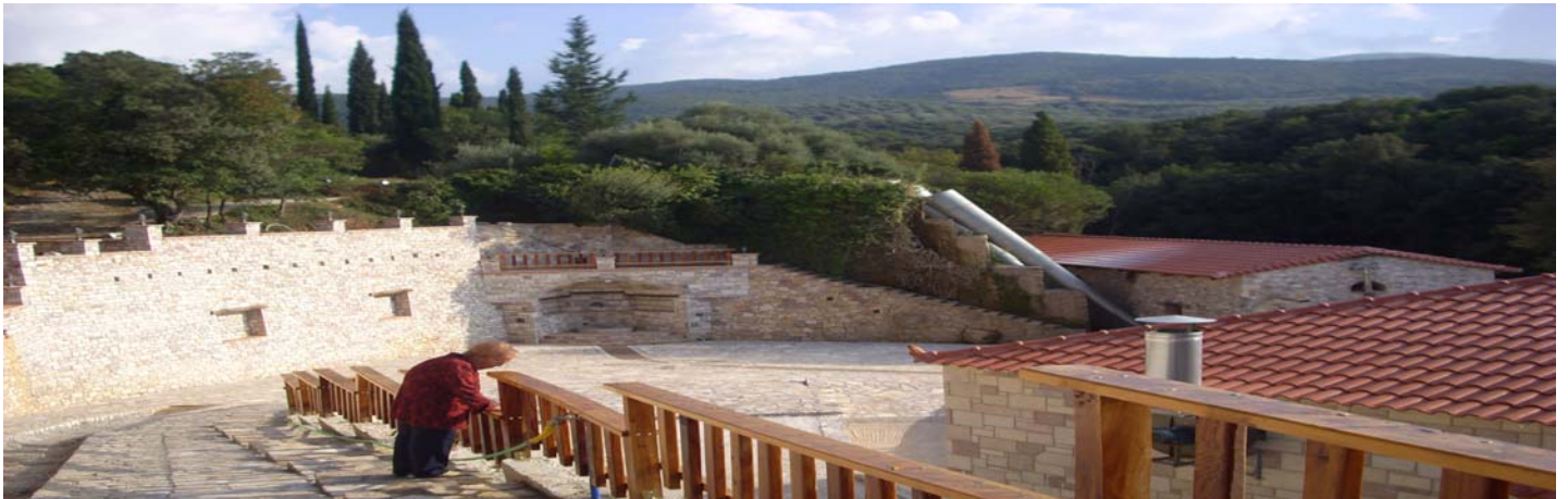
Μύλος Φώτη Τυρογαλά.