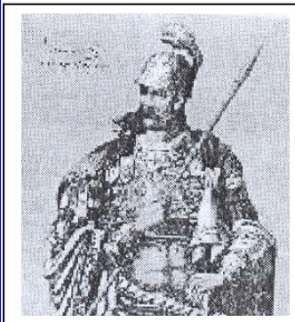
Κων/νος ΙΑ' Παλαιολόγος

διαμορφωμένο συσχετισμό δυνάμεων, η άνοδος δε στην εξουσία του φιλόδοξου Σουλτάνου Μωάμεθ Β' το 1451 έκανε αισθητότερο τον κίνδυνο για την Βασιλεύουσα.